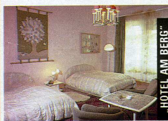
„HOTEL AM BERG“